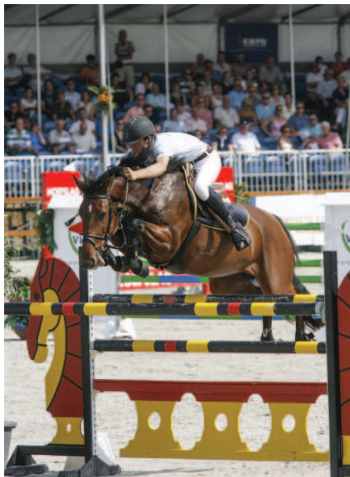
De familie Kramer fokt nog met diverse paarden uit de stam van Kannan. Zo komt deze 1.40m-springende Van Meta (v.Quick Star) uit een halfzus van Kannan.

verwachtingen dubbel en dwars waargemaakt: het bleek een gouden aankoop. Onder Hécart zette Kannan zijn internationale successen voort en debuteerde hij al vrij snel op Grand Prix-niveau. Ook de fokkers lieten het talent van Kannan niet aan zich voorbij gaan, in 2001 dekte hij 270 merries ondanks zijn hoge dekgeld van 8.000 Franse Francs. Ook de jaren daarna dekte Kannan honderden merries per seizoen.